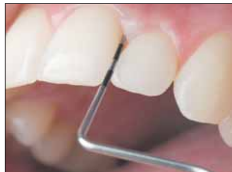
Seit 2004 übernehmen die Kassen alle zwei Jahre die Kosten für einen speziellen Parodontitis-Test.

Auch das Team Ihrer City Apotheke hat sich auf diesen Tag eingestellt: Ein umfassende Beratung sowie kleine Überraschungen passend zur Zahngesundheit erwarten Sie!