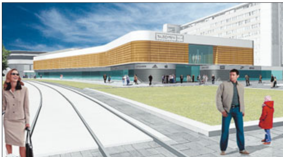
Das Modell des Neubaus kann im Rathaus am Neumarkt besichtigt werden.

Endlich ist es soweit: Anfang 2010 wird mit dem zweiten Bauabschnitt des Blechen Carré begonnen.