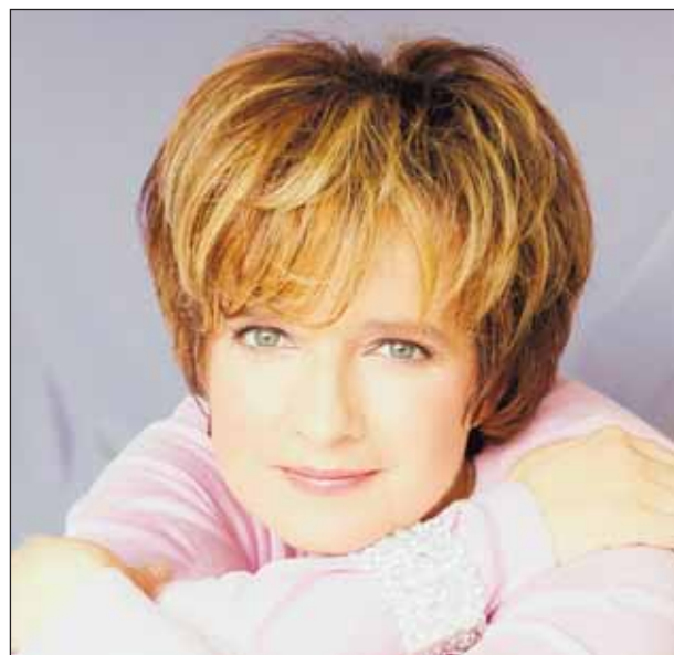
Monika Martin macht auf ihrer Promotion-Tour auch im Blechen Carré Station.

Der nächste Höhepunkt wartet dann schon am 1. Oktober. Schlagersängerin Monika Martin ist mit ihrem neuem Album auf großer Promotion-Tour und ab 15 Uhr im Blechen Carré zu erleben. „Du hast mich geküsst, als wär's zum letzten Mal“, singt die Grazer Künstlerin im Titellied ihrer gleichnamigen neuen CD, die zugleich ihr 16. Album ist. Der Titel strahlt eine ganz bestimmte Fröhlichkeit aus. Es ist ein sehr sympathischer Song, der für die kleinen Signale des Glücks wirbt. Es geht um die richtigen Wörter zur richtigen Zeit, um Gesten, Blicke.