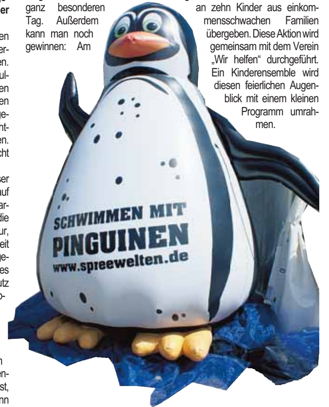
Der große Spreewelten-Pinguin kommt ins Blechen Carré

an zehn Kinder aus einkommensschwachen Familien übergeben. Diese Aktion wird gemeinsam mit dem Verein „Wir helfen“ durchgeführt. Ein Kinderensemble wird diesen feierlichen Augenblick mit einem kleinen Programm umrahmen.