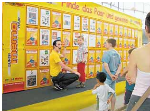
Das beliebte Gedächtnisspiel kommt im Riesenformat zu „Spiele Max“ ins Blechen Carré.

Auf keinen Fall kratzen, sondern kühlende und juckreizstillende Mittel aus der Apotheke besorgen. Hier werden Sie zudem umfassend beraten, auf was Sie noch achten sollten.